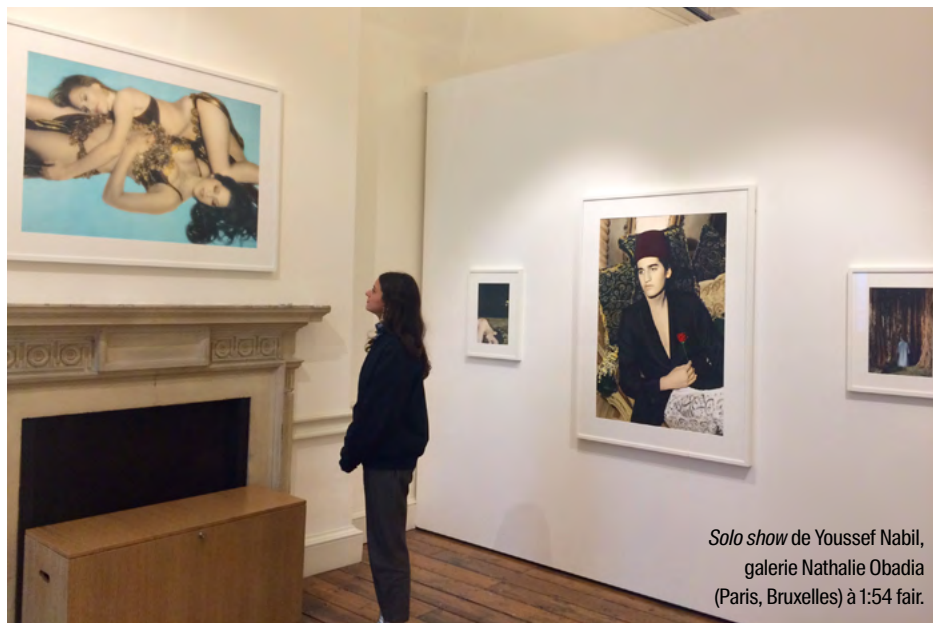
Solo show de Youssef Nabil, galerie Nathalie Obadia (Paris, Bruxelles) à 1:54 fair.