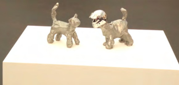
Solo show d'Urs Fischer à la galerie Gagosian à la Frieze Art Fair.