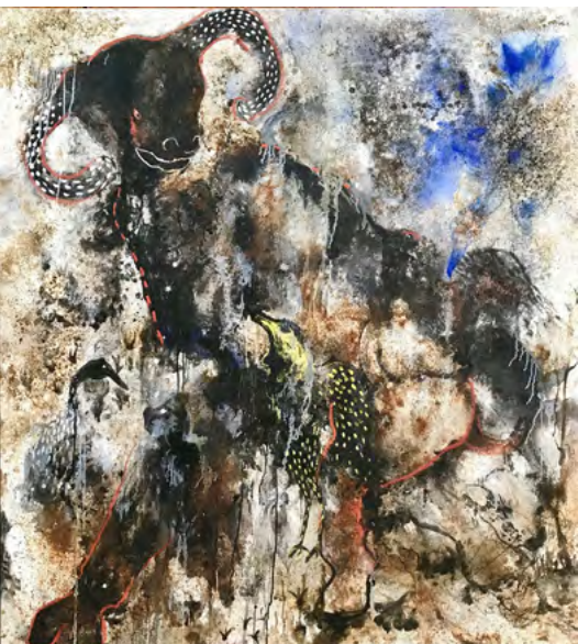
Aliou Diack, Festin , 2018, pigments naturels sur toile, 180 x 158 cm. Galerie Sitor Senghor, Paris.